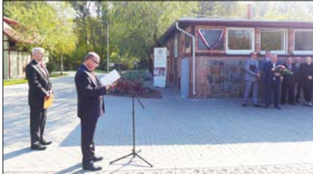
Baza na Zakolu