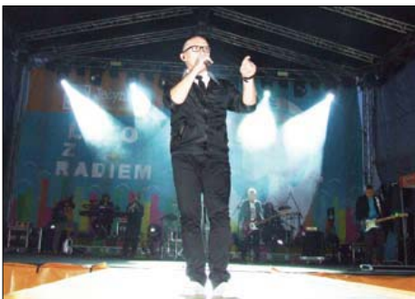
Koncert De Mono