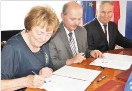
Podpisanie umowy partnerskiej