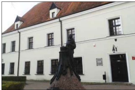
Pałac Anny Wazówny po remoncie

Ze środków własnych miasta Sala Wielka i Bankietowa zostały pomalowane, podłogi wycyklinowane i polakierowane. Wstawiono nowe drzwi wejściowe i zmieniono wygląd facjat w dachu budynku. Wyremontowano i odnowiono pomieszczenia biblioteki. Przebudowano i unowocześniono łazienki.