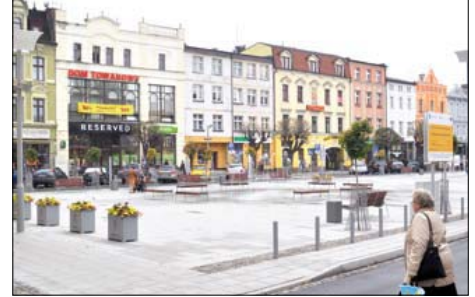
Duży Rynek w nowej odsłonie