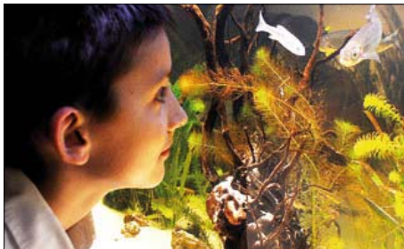
Atrakcją są dwa olbrzymie akwaria

W siedzibie Muzeum w Brodnicy otwarto Centrum Edukacji Ekologicznej. Placówka została wyposażona w nowoczesny sprzęt multimedialny, m.in. cztery kioski informacyjne z zainstalowanymi programami edukacyjnymi. Ilustrują one bogactwo flory, fauny i środowiska przyrodniczego regionu brodnickiego. W gablotach umieszczono modele roślin i grzybów oraz skamieliny pochodzące z naszych terenów. Atrakcją są też dwa olbrzymie akwaria, pokazujące środowiska oraz ryby jeziorne i rzeczne.