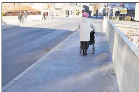
Most przy ul. Mostowej

Rewitalizacja mostu rozpoczęła się we wrześniu 2011 roku. Cała inwestycja kosztowała 4,6 mln zł. Z sumy tej 75 procent wartości inwestycji sfinansowane zostało ze środków unijnych. Długość przeprawy mostowej wynosi 26,59 m, a szerokość - 13,45 m. Most posiada dwuwarstwową nawierzchnię złożoną z warstwy ścieralnej. Po obu stronach jezdni wykonane zostały chodniki o szerokości około 2,70 m każdy.