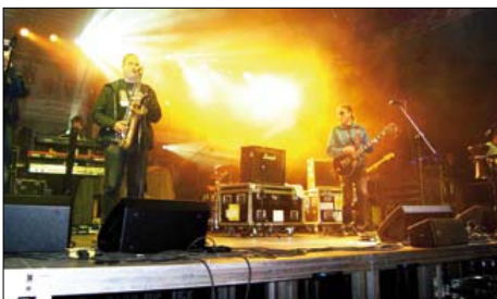
Występ zespołu Daab

Udział we wszystkich organizowanych przez miasto wydarzeniach artystycznych był za darmo.