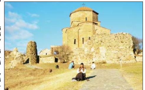
Cerkiew Dzwari, perła gruzińskiej architektury. Pochodzi z przełomu VI i VII wieku. Można zaryzykować stwierdzenie, że dała początek gruzińskiemu stylowi sakralnemu.

Godz. 16.00 – Brodnicki Dom Kultury. Podsumowanie XXIII Tygodnia Kultury Chrześcijańskiej, wręczenie nagród laureatom konkursów, występy laureatów, „Anioły budzą się” – program artystyczny w wykonaniu uczestników WTZ.