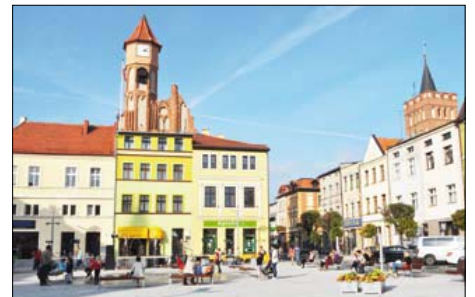
Odnowiona wieża ratuszowa

W ramach prac wymieniono dachówkę, odnowiono ceglane lica murów zewnętrznych oraz tynki. Łączny koszt prac wyniósł ponad 375 tysięcy złotych. W tej kwocie 75 procent kosztów stanowi dofinansowanie z Regionalnego Programu Operacyjnego Województwa Kujawsko-Pomorskiego na lata 2007-2013 z działania Rewitalizacja zdegradowanych dzielnic miasta.