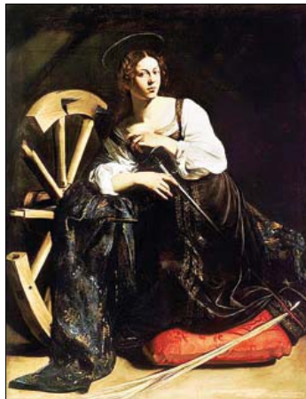
Obraz Caravaggia – święta Katarzyna

Książd proboszcz uważnie obejrzał zdjęcie. Zgadzało się koło, na którym łamano przyszłą świętą. Nie pasowała szpada, ale ostatecznie to też broń. A sama postać