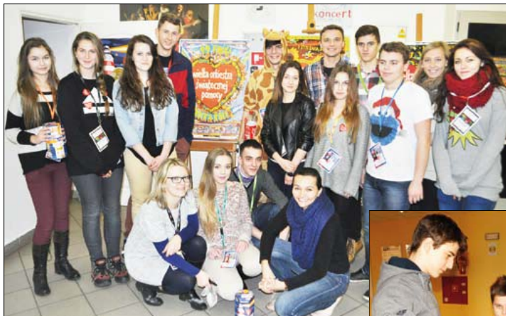
Grupowe zdjęcie członków Młodzieżowej Rady Konsultacyjnej i ich przyjaciół podczas niedzielnego finału w BDK

Młodzieżowa Rada Konsultacyjna już po raz drugi włączyła się w organizację Wielkiej Orkiestry Świątecznej Pomocy w Brodnicy.