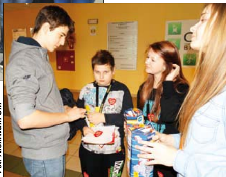
Oprócz groszaków członkowie młodzieżowej rady zbierali też pieniądze do puszek

Ogólnokształcące – 197,11 zł i Gimnazjum nr 2 – 192,82. Ponadto Zespół Szkół Rolniczych zorganizował sprzedaż ciast wykonanych przez uczniów.