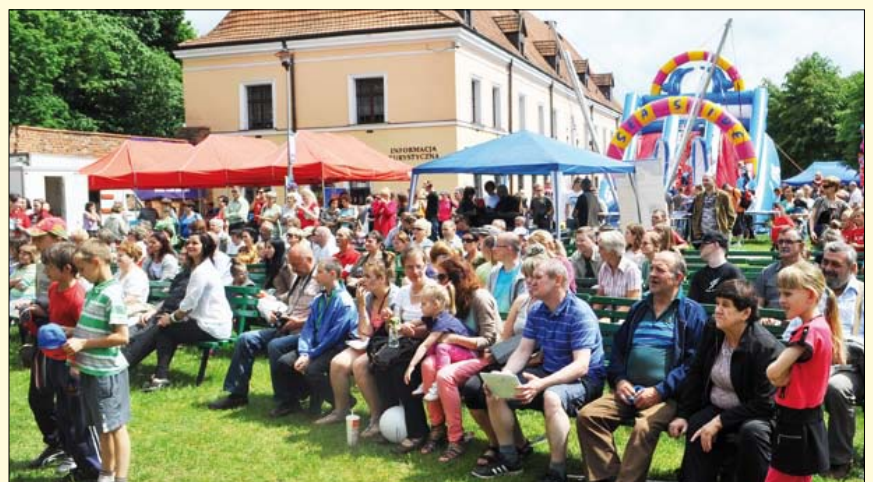
Czas wakacyjnych zabaw i festynowych atrakcji