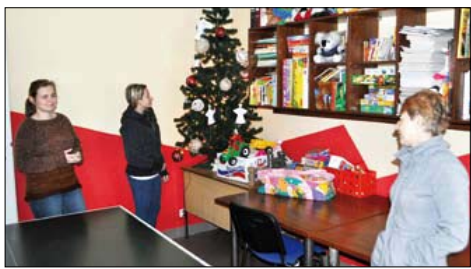
W osiedlowym klubie przy ul. Sikorskiego już powstaje plan zajęć uwzględniający nowych lokatorów