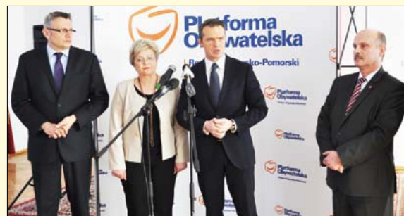
Minister transportu Sławomir Nowak zapowiada budowę brodnickiej obwodnicy w kierunku Olsztyna