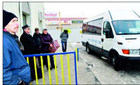
Passażerowie PKS w Brodnicy muszą uzbroić się w cierpliwość

Obiekt dworca zbudowany zostanie na nowo. Będzie on pełnił również rolę handlową jako Galeria Dekada. Powierzchnia jej objętość 1800 mkw. Swoje stoiska mają tu otworzyć m.in. firmy Rossmann, CCC, Neonet i apteka. Jak zapewnia prezes Kujawsko-Pomorskiego Transpor-