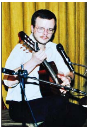
Jacek Kaczmarski w Wiedniu w grudniu 1993