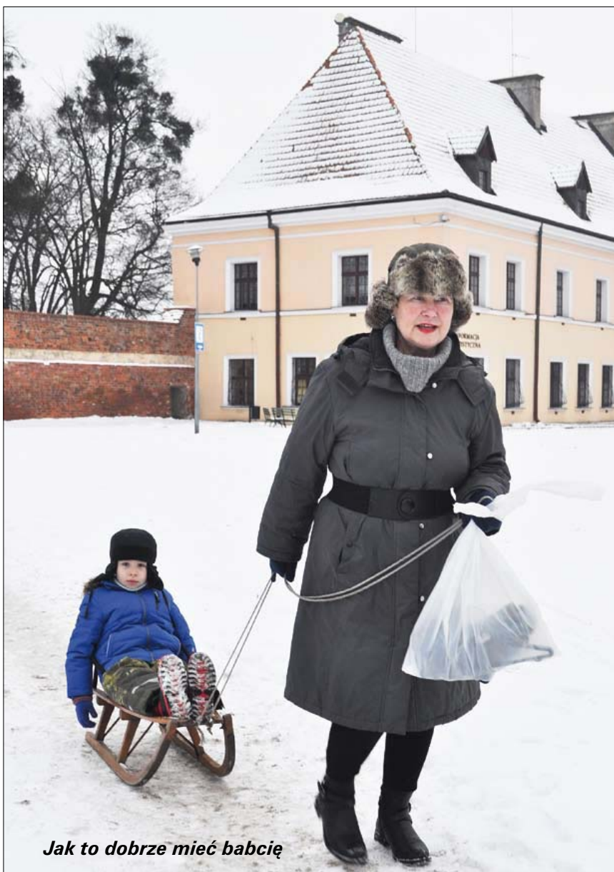
Jak to dobrze mieć babcię