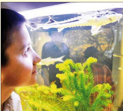
Otwarcie Centrum Edukacji Ekologicznej

W Szkole Podstawowej nr 7 (ZS nr 1) zakończono realizację projektu „Cyfrowa szkoła” deklarując