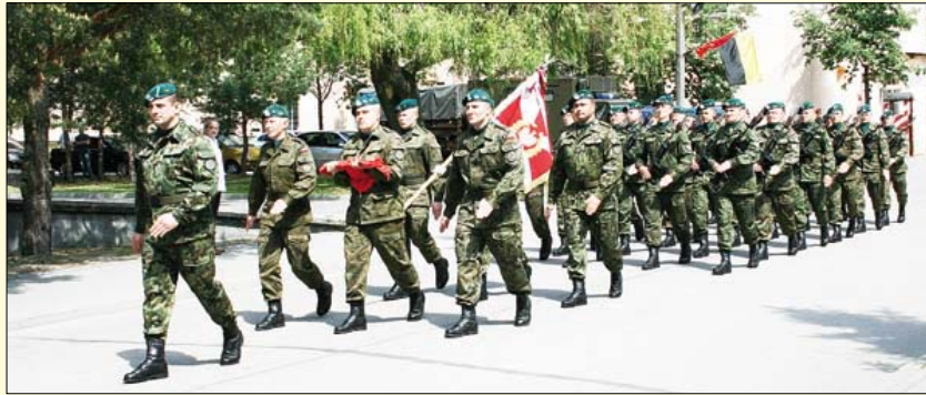
50 lat brodnickich chemików

jego kontynuację. Dzięki udziałowi w programie szkoła wzbogaciła się o nowoczesny sprzęt do nauczania za ponad 280 tysięcy zł.