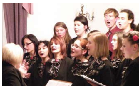
Chór Canto Grazioso.

Miejski Chór Canto Grazioso ogłasza nabór nowych członków. Kto lubi kulturę muzyczną i śpiewanie, znajdzie dla siebie ciekawe zajęcia.