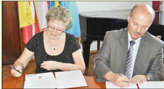
Uroczystości 715 lecia miasta. Burmistrz Brodnicy podpisuje umowę o współpracy z miastami partnerskimi na kolejne lata

Na sesji w dniu 14 marca brodnicki radni przyjęli uchwałę doty-