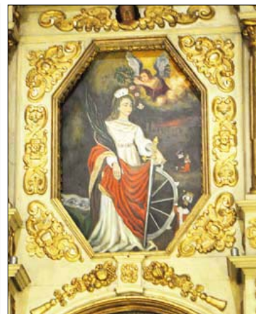
Święta Katarzyna z brodnickiej fary