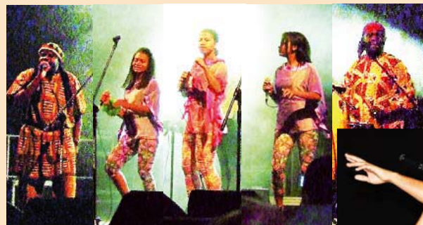
Koncert Jambo Africa