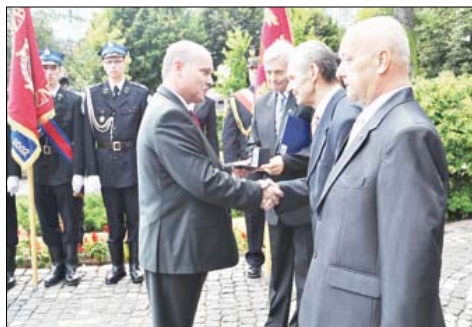
Wręczenia medali dokonał burmistrz miasta