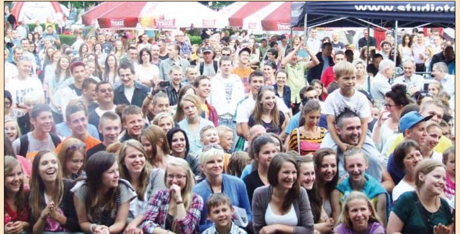
Podczas Dni Brodnicy