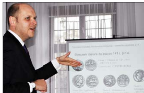
Otwarcie muzeum poprzedziły warsztaty

Wystawa jest współtworzona przy udziale Fundacji „Traditio Europae”, która prowadzi działalność badawczą, popularno-naukową i edukacyjną związaną z antykami greckimi i rzymskimi. Na wystawie obejrzeć będzie można monety rzymskie z prywatnych kolekcji. Swą wiedzę o zabytkach z mennic starożytnych prezentowanych na wystawie, podczas wernisażu podzielił się