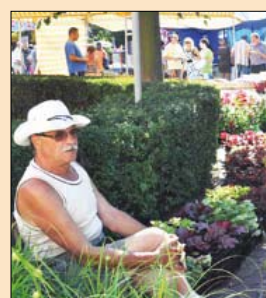
Jarmark Ekologiczny przyciągał miłośników kwiatów