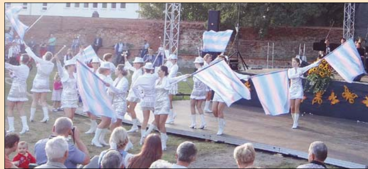
To już dwudzieste impresje. Jak ten czas leci....