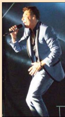
Zagrały zespoły: DAAB, DonGuralEsko, Volwer