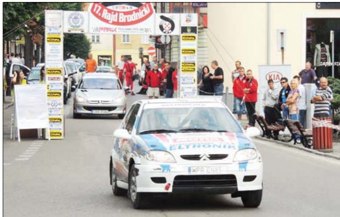
Start rajdu odbył się tradycyjnie na ulicach miasta

W sobotę 31 sierpnia na Dużym Rynku w Brodnicy gościliśmy 35 załóg rajdowych biorących udział w XVII Rajdzie Brodnickim. Rajd jest rozgrywany jako 8 runda Pucharu Polski Automobilklubów i Klubów PZM oraz 4 runda Mistrzostw Okręgu KJS PZM Bydgoszcz. Kierowcy mieli do pokonania 90 kilometrów trasy oraz 12 prób specjalnych.