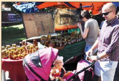
Dobrze bawiły się dzieci i rodzice