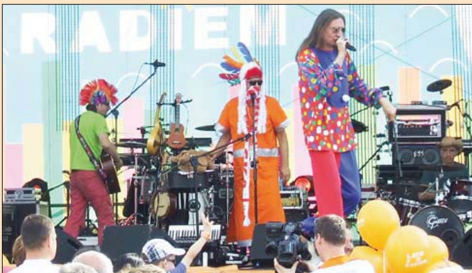
Lato z Radiem w Brodnicy

Sierpień rozpoczęliśmy w wyciszeniu i z powagą oddając 1 sierpnia część bohaterom powstania warszawskiego w 69 rocznicę wybuchu powstania. Uroczystości patriotyczne odbyły się także 18 sierpnia w Lasku Miejskim. Okazją była przypadająca w tym roku 93. rocznica Bitwy Polsko-Bolszewickiej pod Brodnicą.