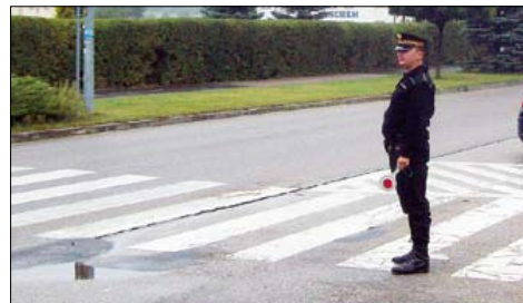
W trosce o bezpieczeństwo dzieci przed brodnickimi szkołami w godzinach porannych pojawiają się strażnicy miejscy

Skutki nieodpowiedzialnego zachowania się kierowców mają groźne konsekwencje i to nie tylko dla sprawców kolizji i wypadków, ale dotyczą również innych użytkowników dróg, którzy