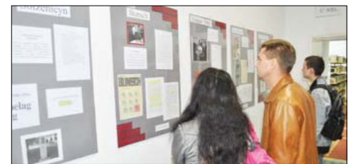
Wystawa „Brodnica w literaturze”