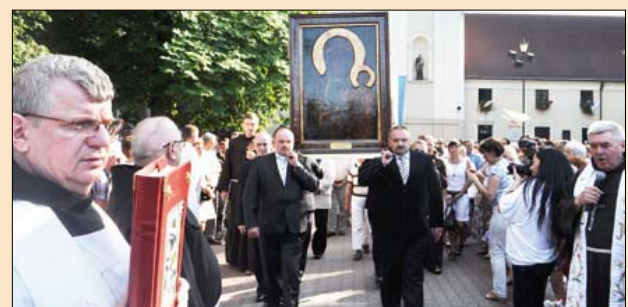
Obraz Matki Boskiej nieprędko trafi ponownie do Brodnicy