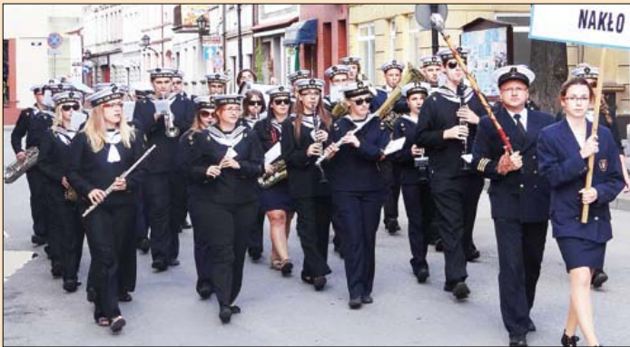
Przemarsz orkiestry z Nakła podczas marszu gwiazdzistego