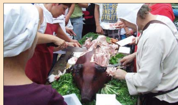
.... i tyle zostało ze świniaka