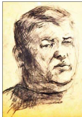
Szkic do portretu taty

Na pewno wpływ na jej rozwój w dziedzinie plastyki miała mama, która ukończyła studia malarskie. Mała Natalia podglądała jak mama zmagając się z wielkimi olejnymi obrazami i sama zaczęła malować olejami psy, koty, konie i inne zwierzęta. Jej szczególne umiejętności plastyczne widać było już po pracach wykonywanych w przedszkole. Po ukończeniu Gimnazjum nr 2 została uczennicą Liceum Pla-