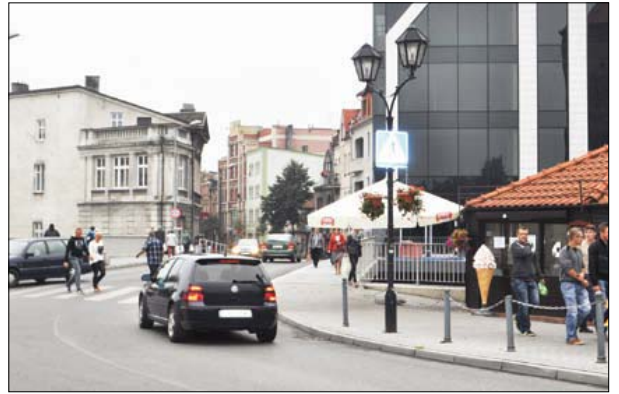
Widok współczesny tego miejsca