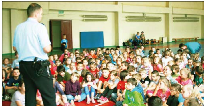
Brodnicki policjanci przy każdym spotkaniu z dziećmi i młodzieżą wpajają uczniom zasady bezpiecznej drogi do domu i do szkoły.

Od kilku dni po wakacyjnej przerwie do szkół ruszyły nasze dzieci. Wiele z nich przekroczyło szkolny próg po raz pierwszy. Swoją troskę o bezpieczeństwo dzieci okazują rodzice i nauczyciele. Jesteśmy codziennie świadkami nieodpowiedzialnego zachowania się kierowców na drodze, którzy stwarzają zagrożenie wynikające z nadmiernej prędkości i brawury jazdy.