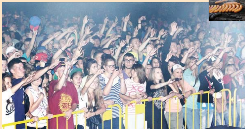
Występy spotykały się z żywą reakcją publiczności