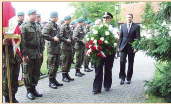
W 69. rocznicę wybuchu powstania warszawskiego złożono kwiaty pod pomnikiem Żołnierzy AK