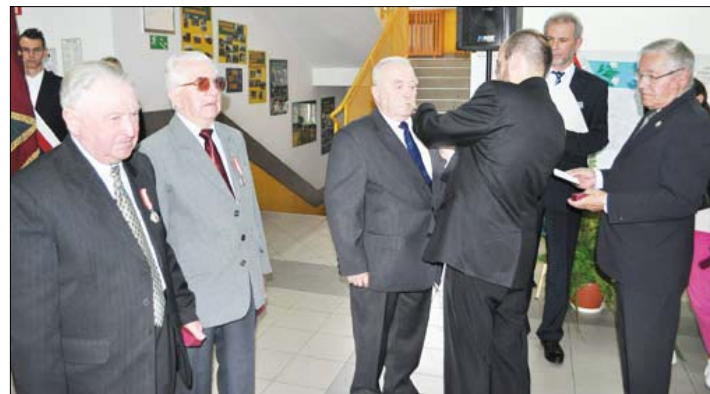
Dekoracja medalami zasłużonych Sybiraków

Podczas tegorocznego spotkania w „rolniczówe” wręczono medale kolejnej grupie osób zasłużonych dla podtrzymywania pamięci o losach tysięcy Polaków, którzy stali się ofiarami sowieckiego totalitaryzmu. Srebrną Odznakę za Zasługi dla Związku Sybiraków otrzyma-