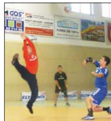
Piłka w grze

31 sierpnia w hali Ośrodka Sportu i Rekreacji gościli piłkarze ręczni z Bydgoszczy, Łodzi, Koronowa oraz Brodnicy. Organizatorem turnieju seniorów piłki ręcznej był MKS Eltronik. Zawody potraktowano jako sprawdzian dla brodnickiego MKS przed II ligowymi rozgrywkami. Nasi szczypiorniści egzamin zdali celująco, wygrywając cały turniej.